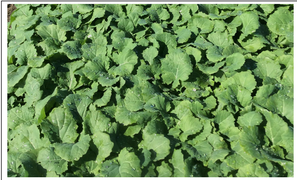
Dyrkning af LILPUT salat.

Art: LILPUT er hvidblomstret raps, Brassica napus .